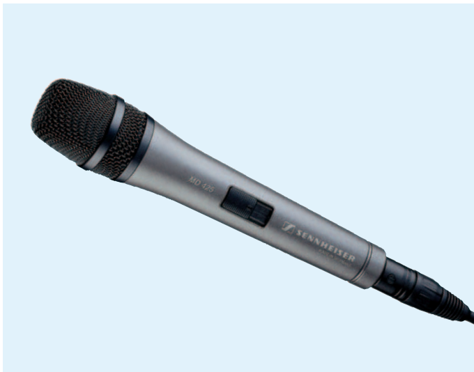
Das abgebildete Kabel gehört nicht zum Lieferumfang.

Das MD 425 ist ein hochwertiges dynamisches Mikrofon mit Supernierencharakteristik, das aufgrund seiner ausgezeichneten klanglichen Eigenschaften für Gesangs- und Sprachübertragung in allen Bereichen der Tonübertragungstechnik bestens geeignet ist. Farbe: hämatit-stahlblau (Griff).